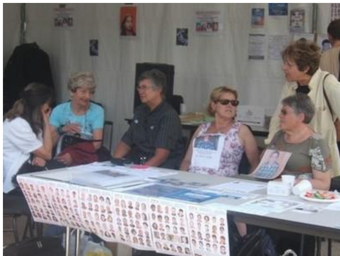
Familles Membres de MANU association, au rassemblement du Champ de Mars à PARIS, pour les cérémonies du 25 mai 2009