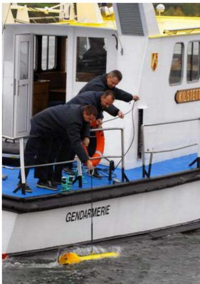
Un câble permet de relier le sonar au bateau et de transmettre les informations.

Le bilan d'activité de 103 opérations de repérage a été présenté, hier à Strasbourg, lors de la première réunion du Conseil de coordination